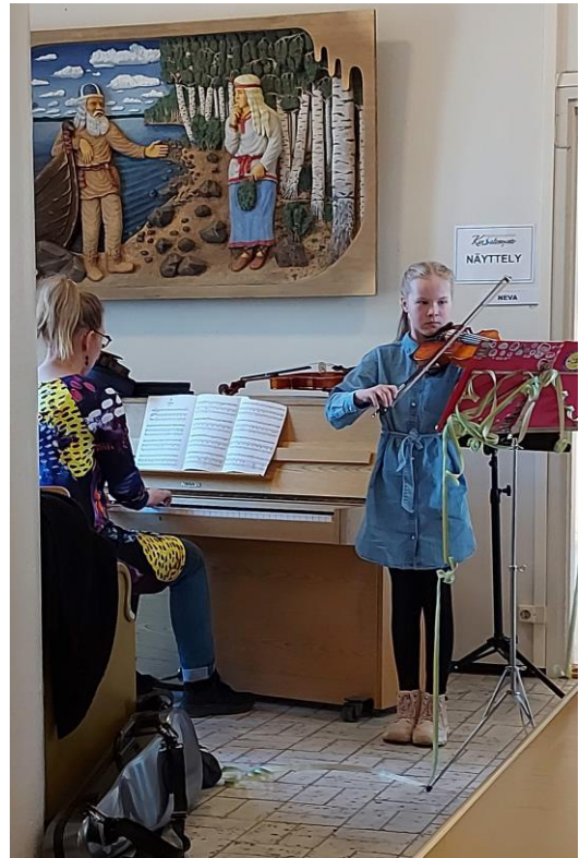
Kuvia Perhon kevätjuhlasta ja -näyttelystä: