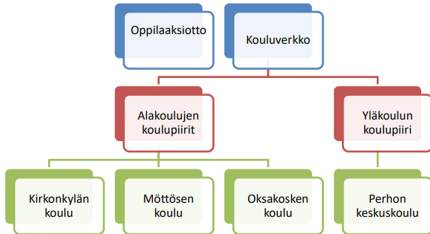
Kuvio 1. Perhon kunnan kouluverkko ja koulupiirit

Lähikoulun osoittamismenettely tarkoittaa koulua, johon on oppilaan kodista lyhin matka. Lähikoulu määräytyy oppilaan kotiosoitteen perusteella.