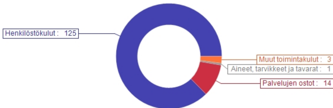
Toimintakulujen jakauma (1 000 €)