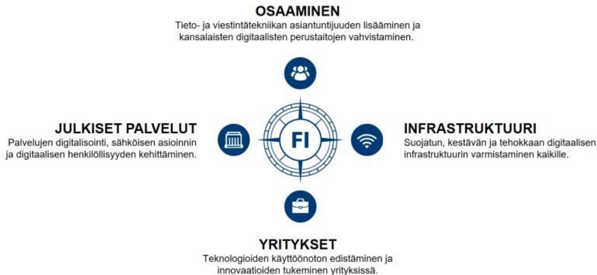
Kuvio 1. Valtioneuvosto, Digitaalinen kompassi.

Keski-Pohjanmaan maakunnan digikompassi on ottanut ensiaskeleensa neljän työryhmän voimin; digitaalisen osaamisen, infrastruktuurin, yritysten digitaalisen murroksen ja julkisten palveluiden digitalisaation työryhmät ovat täydessä toiminnassa. Ensimmäisissä työpajoissa tarkasteltiin kompassin jokaista kärkeä, kartoittaen maakuntamme nykytilannetta ja visioita tulevaisuudesta. Työpajoissa toteutettiin myös nelikenttäänalyysit ja ne toimivat perustana digitavoitteidemme ja toimenpidekokonaisuuksiemme rakentamiselle. Aikatauluun (Arnberg 2023) oli myös merkitty sidosryhmien ja kuntalaisten kuuleminen; mielipiteitä Keski-Pohjanmaan digikompassista. Suunnitelmana oli avoin sidosryhmätilaisuus, etäyhteyksiä hyödyntäen, loppuvuodesta 2023, jossa kaikki olivat tervetulleita jakamaan ajatuksiaan ja ideoitaan.