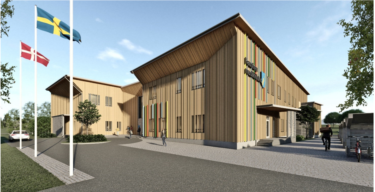
Havainnekuva Musiikkilukion uudisrakennuksesta